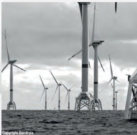
Wikinger Offshore Wind Germany